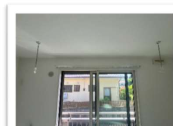
室内干し天井吊り下げ