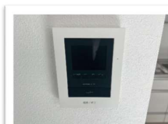
TV付きインターホン